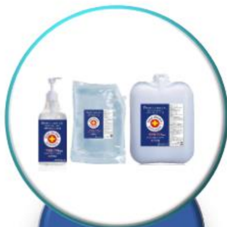
알코올 손 소독 겔