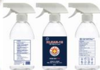
알코올 소독 스프레이 500ml 분무기형으로 편리한 사용