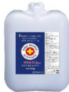
알코올 손 소독 겔 18l 대형 펌프 용기 18l 에 사용되는 리필용