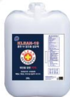
알코올 살균제 20ℓ 리필용