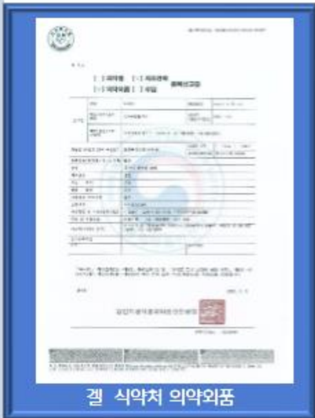
겔 식약처 의약외품