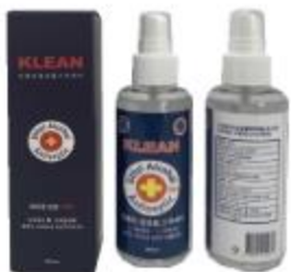
알코올 소독 스프레이 150ml 가정용, 작은 사무실에 두고 사용