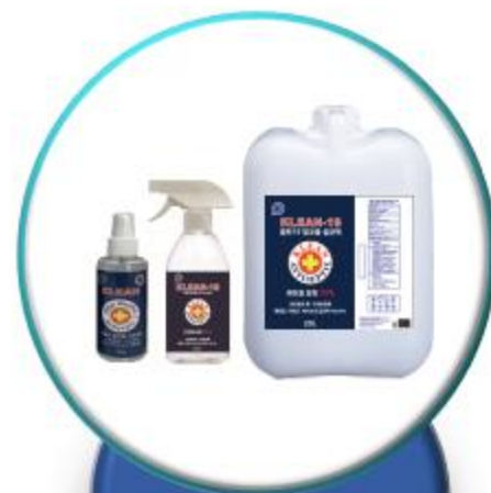
알코올 소독 스프레이