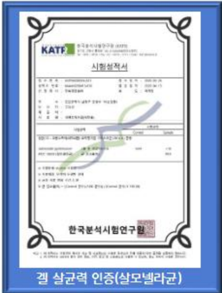
겔 살균력 인증(살모넬라균)