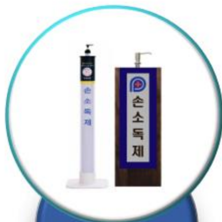
대형 펌프 용기