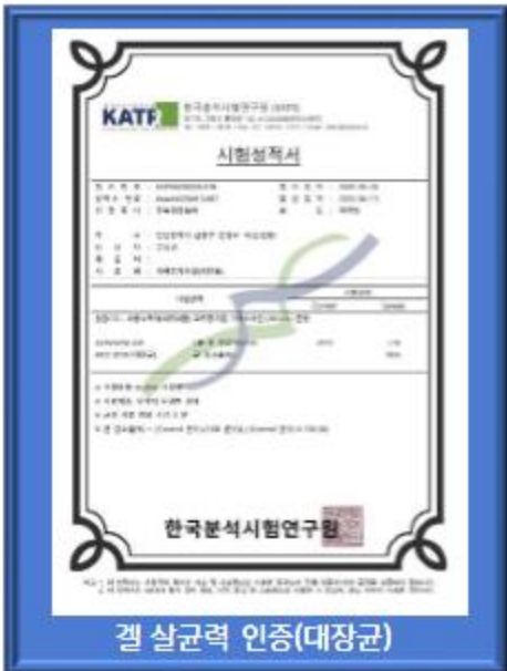
겔 살균력 인증(대장균)