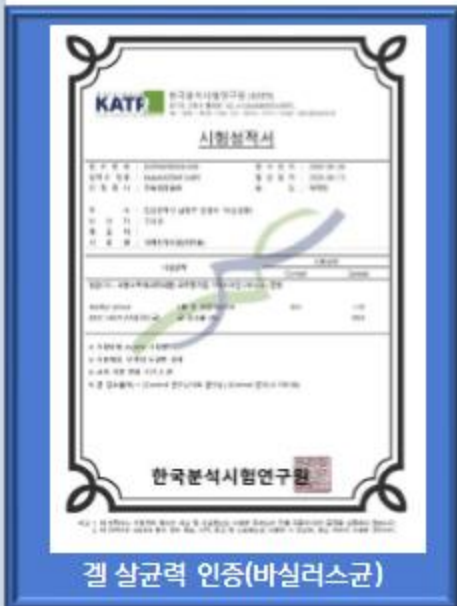
겔 살균력 인증(바실러스균)