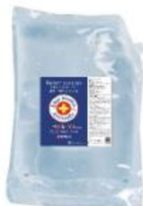
알코올 손 소독 겔 5l 대형 펌프 용기 10l 에 사용되는 리필용