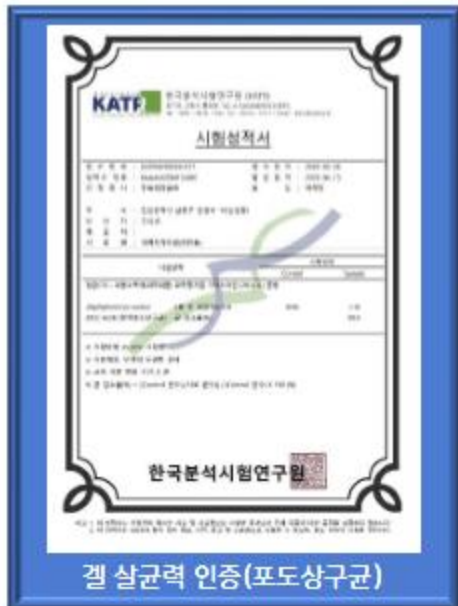
겔 살균력 인증(포도상구균)